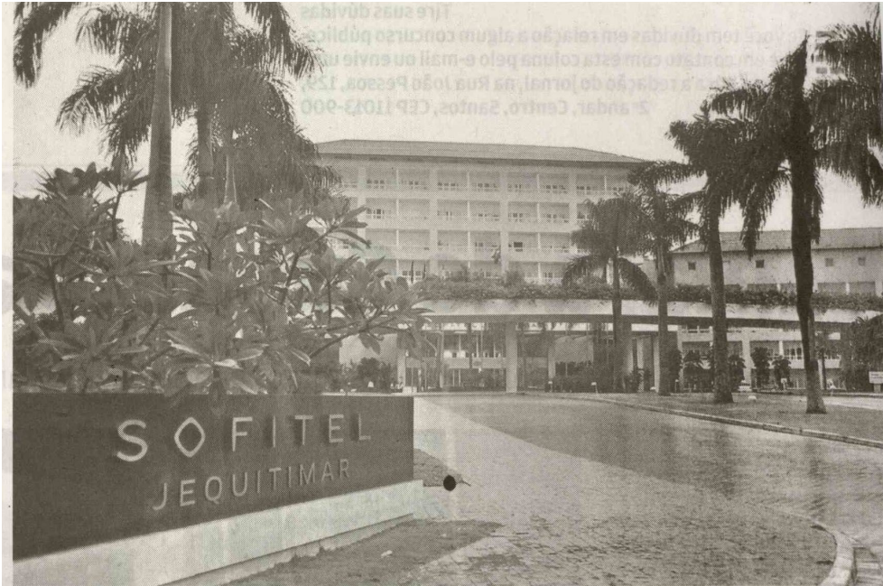
Para presidente do SRC&VB, Guarujá pode oferecer hospedagem e em Santos seriam realizados os treinos

enalteceu esse potencial em encontro da Associação dos Prefeitos das Cidades Estância do Estado de São Paulo (Apre-cesp), realizado sábado.